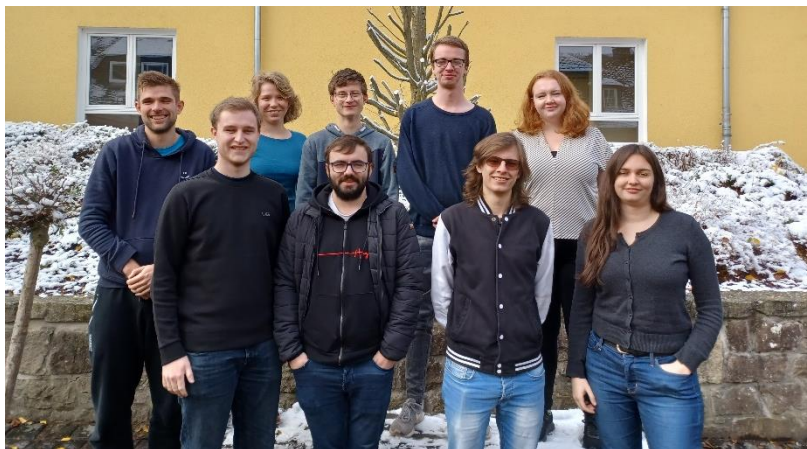
Die Mitglieder des AK Jugendarbeits.