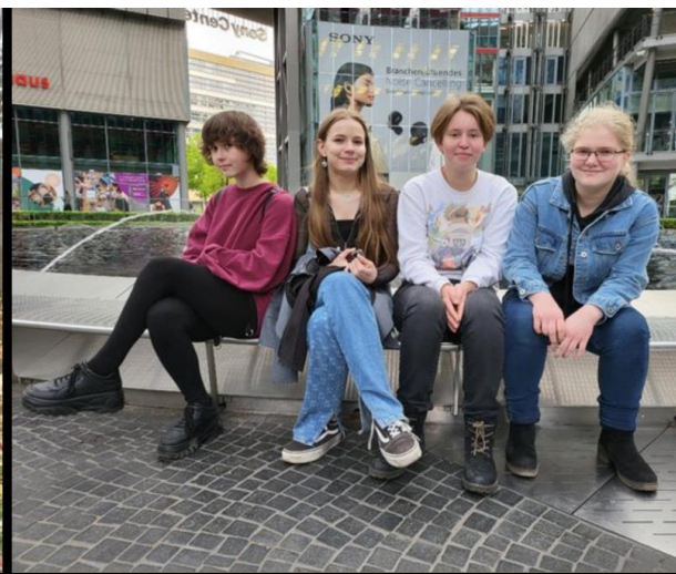
Team des Jahres: USV Halle DVM 2021 U16w