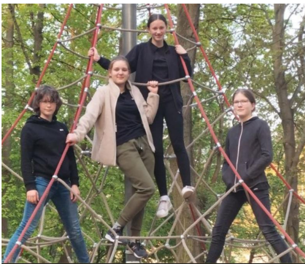
Überraschungsteam des Jahres: Karlsruher SF 1853 DVM 2021 U16w